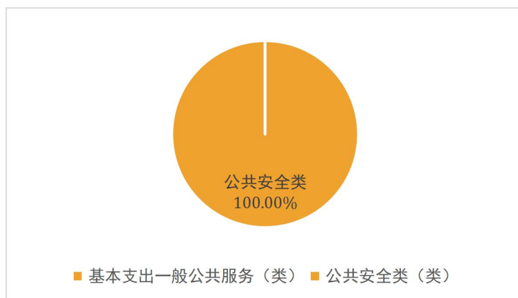
图 3：财政拨款支出决算结构（按功能分类）

2018 年度财政拨款支出 260.90 万元，主要用于以下方面：一般公共服务（类）支出 0.003 万元，占 0%；公共安全类（类）支出 260.90 万元，占 100%。如图所示：